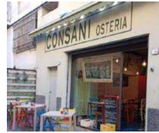
Consani Osteria - Ventimiglia