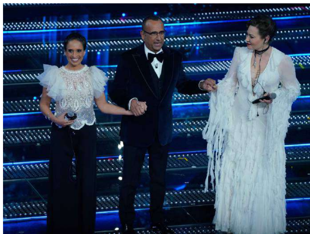
Carlo Conti, direttore artistico e conduttore del 75° Festival di Sanremo tra Noa e Mira Awad

Il gruppo Netweek in prima linea con «Fuori dal Festival»