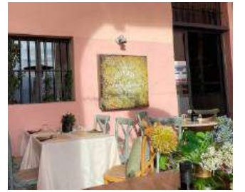
Il Bistrot del Tempo Perduto - Imperia