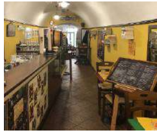
La Porta Verde - Sanremo