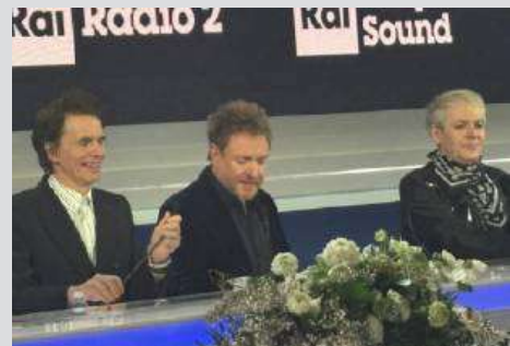
I DURAN DURAN IN SALA STAMPA

La storica formazione tornerà al 75° Festival della Canzone Italiana nella serata di giovedì 13 febbraio, unici ospiti internazionali, su volontà del direttore artistico Carlo Conti , che proprio nel 1985 cercò un'intervista- da implume inviato