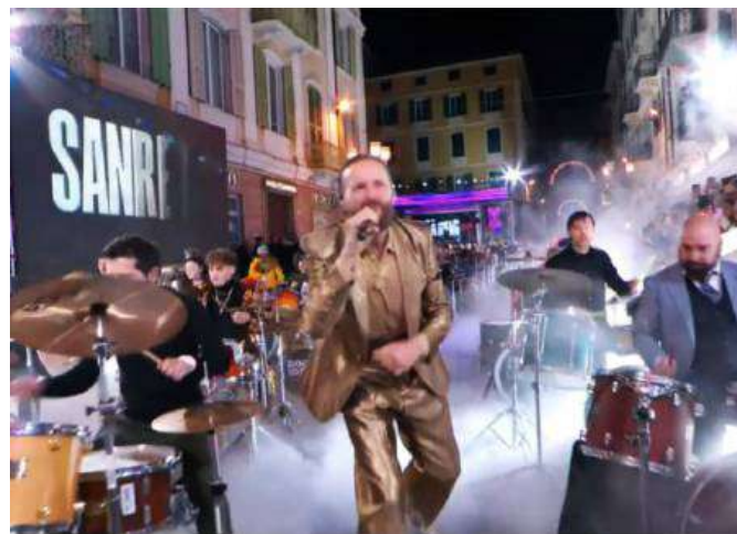
SANREMO 2025 Jovanotti fuori dall'Ariston circondato dai Rockin'1000

Dal 2019 i Rockin'1000 iniziano ad esibirsi anche fuori dall'Italia. Pietra miliare lo